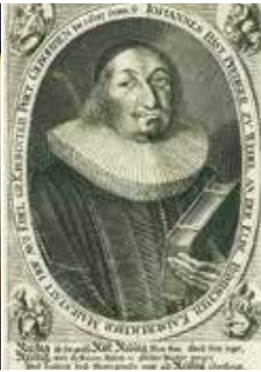
Johann Rist 1607-1667