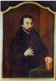
Friedrich Spee (1591-1635)