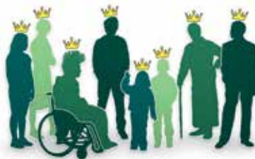
Verschiedene Menschen, die alle eine Krone tragen, die sinnbildlich dafür steht, dass sie alle vor dem Gesetz gleich und gleichwertvoll sind.

Das Grundgesetz stellt die Menschenwürde an die erste Stelle. Dazu gehört das Recht, frei und sicher zu leben und seine Meinung offen äußern zu können. Jährlich am 10. Dezember feiern wir weltweit den „Internationalen Tag der Menschenrechte“. Anlass dafür ist die Verabschiedung der Allgemeinen Erklärung der Menschenrechte der Vereinten Nationen (UN) am 10. Dezember 1948.