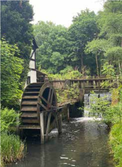
Bremsdorfer Mühle

Einladung zur Familienfreizeit vom 20. bis 22. September 2024