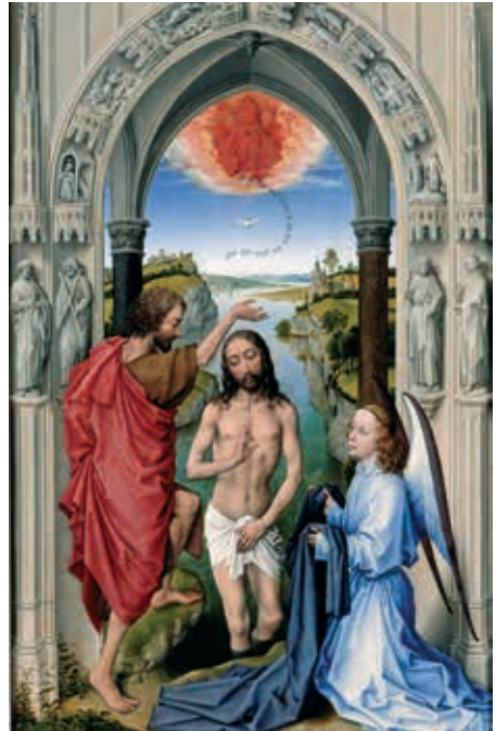
Abb. Die Taufe Christi auf dem Johannesaltar von Rogier van der Weyden (um 1455)

Zu den herausragenden Werken der altniederländischen Malerei zählt der Johannesaltar von Rogier van der Weyden, der sich ebenso wie ein zweiter Altar des Meisters in der Gemäldegalerie Berlin befindet. Darauf wird die Taufe Christi im Jordan von zwei Tafeln mit der Geburt und Namensgebung des Heiligen Johannes und seiner Enthauptung gerahmt, wobei der Taufdarstellung wegen ihrer heilsgeschichtlichen Bedeutung die zentrale Stellung zukommt. Die Darstellung entspricht der biblischen Erzählung, wobei der Heilige Johannes als Rückenfigur in das abgebildete Geschehen hineinführt. Sie wird jedoch durch einen Engel mit dem Mantel Christi als Diakon ergänzt: Er zeigt, dass der Glaube voller Andacht und Demut gelebt werden soll. Die Szene wird von einem gotischen Kirchenportal in Grisaille-Malerei gerahmt. Im Gewände sind beiderseits auf Augenhöhe die Apostel Jacobus Major und Johannes Evangelist sowie Petrus und Andreas mit ihren Attributen abgebildet. Die bekronende Hohlkehle schmücken sechs Reliefs, in denen der Vater des