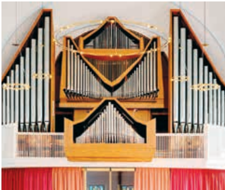
Die Weigle-Organ in der Markus-Kirche