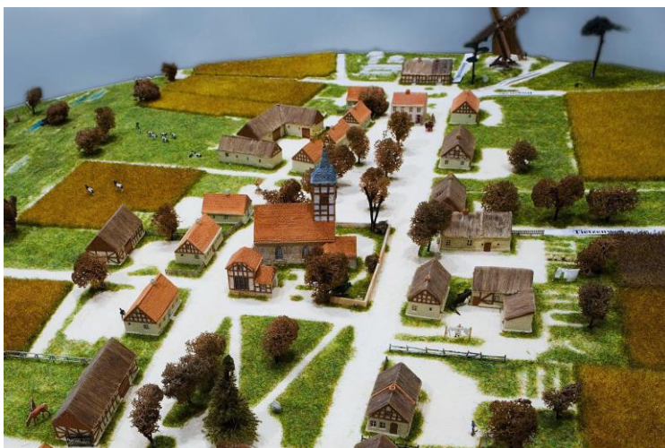
Die Lichterfelder Dorfaue um 1850.

Das Modell steht im Heimatverein von Steglitz e.V. 12205 Berlin-Lichterfelde Drakestraße 64a.