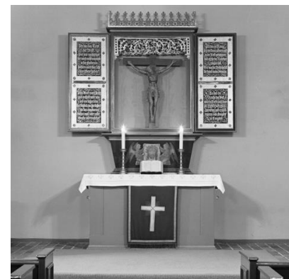
Der Altar aus Döberitz stand von 1941 bis 1993 in der Dorfkirche.

2018-2022 Renovierung des Innenraumes und Schutz gegen das Eindringen von giftigen Holzschutzmitteln aus dem Dachraum.