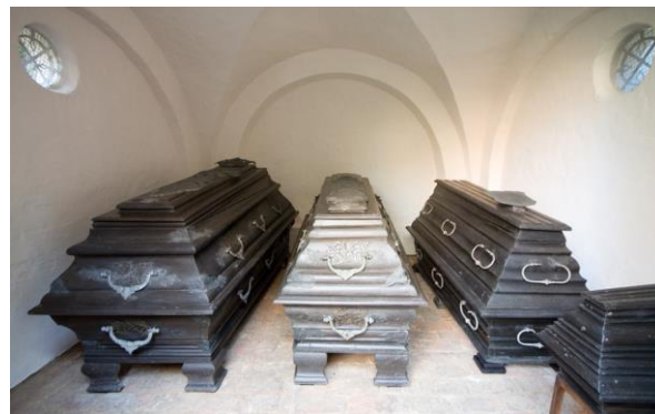
Die Gruft der Familie von Bülow befindet sich auf der Nordseite der Kirche.