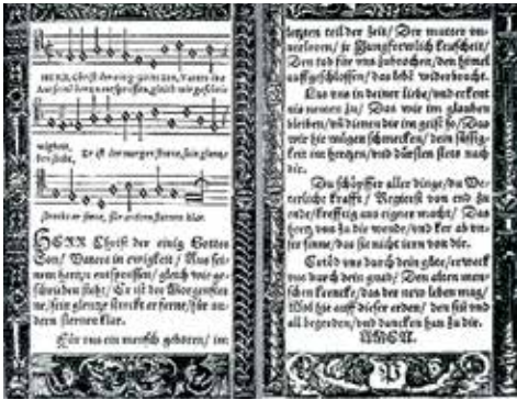
Herr Christ, der einig Gotts Sohn (EG 67)